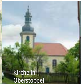
Kirche in Oberstoppel