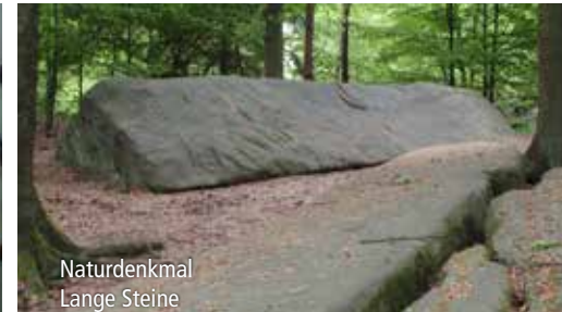
Naturdenkmal Lange Steine

Freizeit · Erlebnis Haunetal-Wanderwege und ihrer Anschlussmöglichkeiten