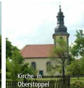
Kirche in Oberstoppel