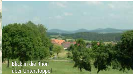
Blick in die Rhön über Unterstoppel