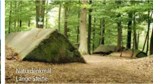
Naturdenkmal Lange Steine