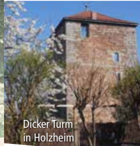
Dicker Turm in Holzheim