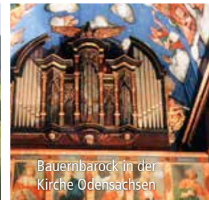
Bauernbarock in der Kirche Odensachsen